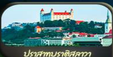
ปราสาทบราติสลาว่า