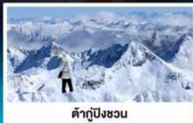
ต้าถู่ปิงชว่น