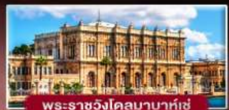
พระราชวังโดลมาบาห์เซ่