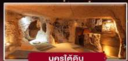
นครใต้ดิน