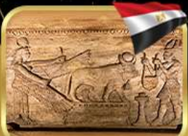
สุสานใต้ดินอเล็กซานเดรีย

5วัน 3คืน 10-14 เม.ย. 69 (วันสงกรานต์) 11-15 เม.ย. 69 (วันสงกรานต์) 29 เม.ย. - 3 พ.ค. 69 (วันแรงงาน)