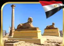
เสาสีมันปอมเปย์