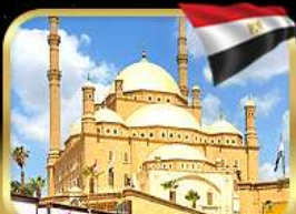
มัสยิดโมฮัมหมัดอาลี