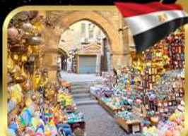
ตลาดชานอลคาลิ