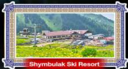
Shymbulak Ski Resort