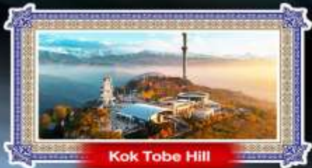
Kok Tobe Hill