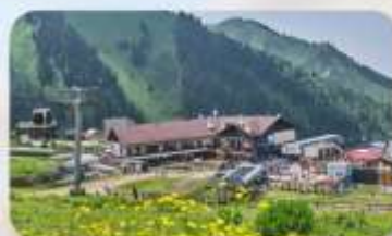
Shymbulak Ski Resort