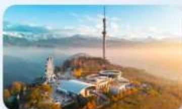
Kok Tobe Hill