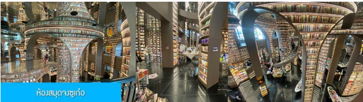
ห้องสมุดจงชู่เกอ

หลังอาหารนำท่านชม สะพานหนานเจียว 南桥 สะพานโบราณพร้อมแม่น้ำจูเจียงเย็นขึ้นชื่อที่ได้กลายเป็นแหล่งท่องเที่ยวสำคัญและจุดเช็คอินสำหรับนักท่องเที่ยว ในช่วงค่ำที่นี่จะประดับประดาด้วยแสงสี บริเวณริมแม่น้ำจะถูกประดับด้วยแสงไฟสีฟ้าที่ทอดยาวไปตามแนวแม่น้ำ ชาวบ้านตั้งชื่อว่าเป็น น้ำตาสีฟ้า 蓝色眼泪 พักที่ โรงแรม CENTER INTER HOTEL ระดับ 4 ดาวท้องถิ่นหรือเทียบเท่าในเมืองจูเจียงเย็น