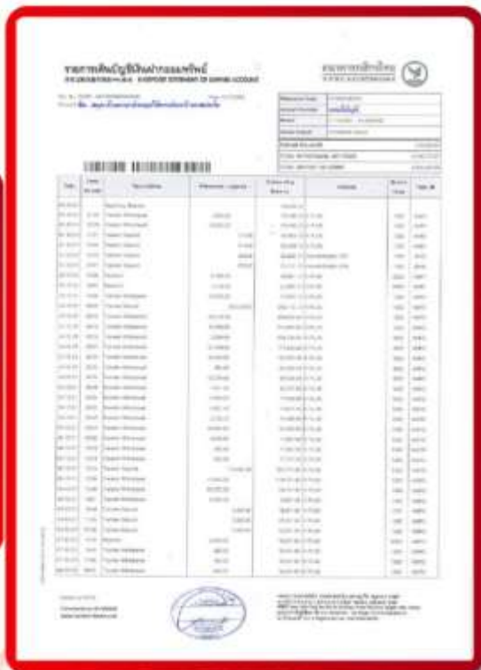
ตัวอย่าง Bank Statement ที่ผู้สมัครต้องขอจากธนาคาร

3.4 ปรับสมุดบัญชีธนาคารตัวจริง และเตรียมไปในวันที่ยื่นวีซ่า