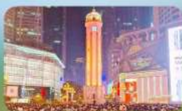
ถนนคนเดินเจียฟางเป่ย์