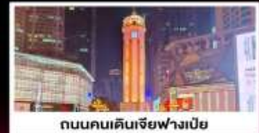
ถนนคนเดินเจียฟางเปี่ย