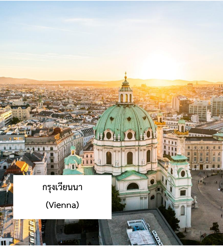
กรุงเวียนนา (Vienna)

เมนูพิเศษ!!! กลูชาซูป อาหารประจำชาติฮังการี