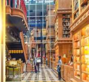
ร้านไอศกรีมมियाฮาร่า