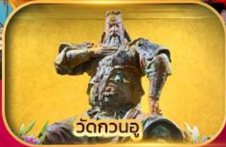
วัดกวนอู