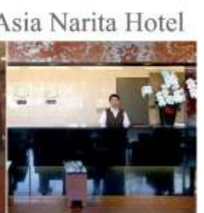
Asia Narita Hotel