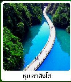
หุบเขาสิงโต