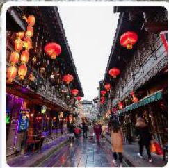
ถนนโบราณจีนหลี