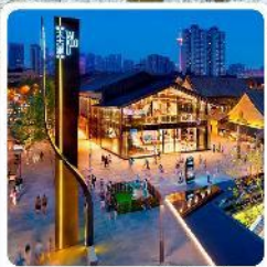
ถนนคนเดินไท่กุ๋หลี