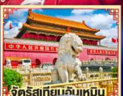
จัตุรัสเทียนจันเหมิน