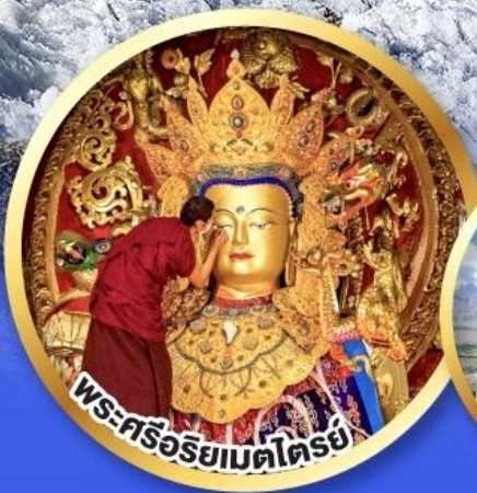
พระศรีอริยเมตไตรย์