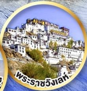
พระราชวังเลห์