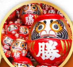
วัดคัตสึโฮจิ (วัดदारุมะ)

ชมความงามของกำแพงหิมะ เส้นทางสายอัลไพน์ทาเคยาม่า (JAPAN ALPS SNOW WALL)