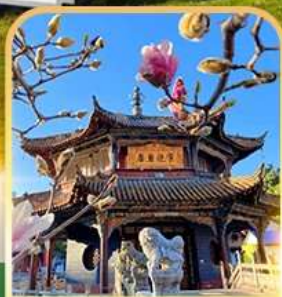
วัดหยวนทอง