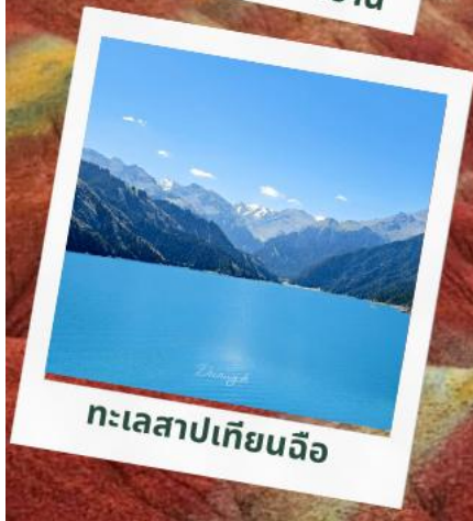
ทะเลสาปเทียนฉือ