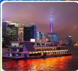
ล่องเรือแม่น้ำหวงผู่