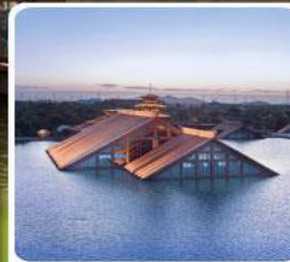
พิพิธภัณฑ์ไต้หน้ำกวงฟู่หลิน