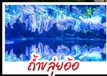
ถ้ำหลู่ฮ้อ