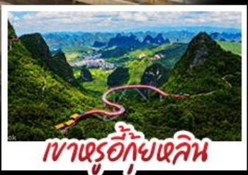
เขาตรู้อีกุ้ยหลิน