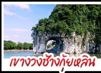
เขางวงช้างกุ้ยหลิน

สองเรือแม่น้ำที่ฉงชิ่ง สวนสตรอว์เบอร์รี่ ทัศนียภาพที่งดงาม นั่งบอลูนชมวิว 360 องศา ทางวงช้างกุ้ยหลิน ทำฟู้้อ พาทู้อ เมืองกุ้ยหลิน รถไฟความเร็วสูง พักโรงแรมระดับ 5 ดาว เมบูอาหารพิเศษ POP MART