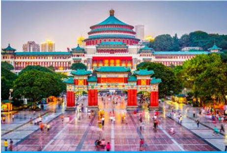
ศาลาประชาชน