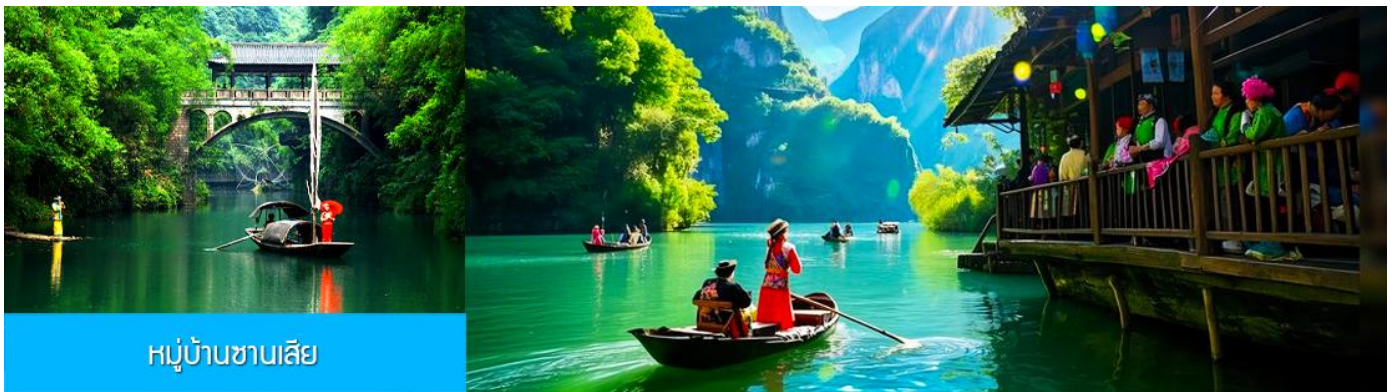
หมู่บ้านชานเลีย

พักที่ YICHANG HUIHAO HOTEL โรงแรมระดับ 4 ดาวหรือเทียบเท่าในเมืองหยีซาง