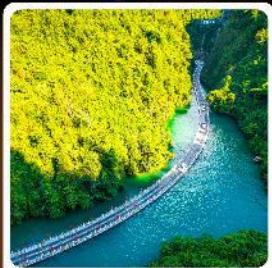
คุบเขาสิงโต

ไฮไลท์! ปีนตรลงเอนชอ ที่ยวเอนชอนั้นๆจัดทีมทั่วเมือง คุบเขาสิงโต ผิงชานแกรนด์แคนยอน อุกยานจีนลู่ชาน