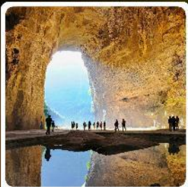
ถ้ำถึงหลง