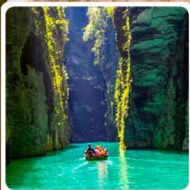
ผิงชานแกรนด์แคนยอน