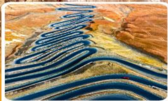
ถนนผานหลงกู่ต้าอว