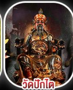
วัดบิกิต