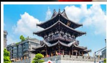
หอชิวหยง