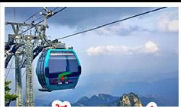
กระเช้าเขาเหยาซาบ