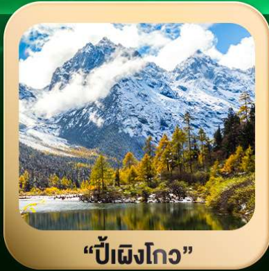
“ปี่ผิงโกว”

ชมธรรมชาติ 2 อุทยานขึ้นชื่อ อุทยานภูเขาสี่ครุณี + อุทยานปี่ผิงโกว สะพานหนานเฉียว • ถนนคนเดินไท่กู่หลี่ + ซุนซีลู่ + Pop Mart • ดงเจียวจื่อ