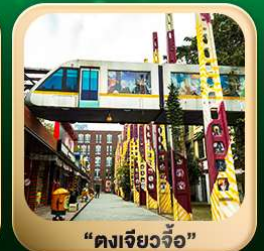
“ดงเจียวจื่อ”