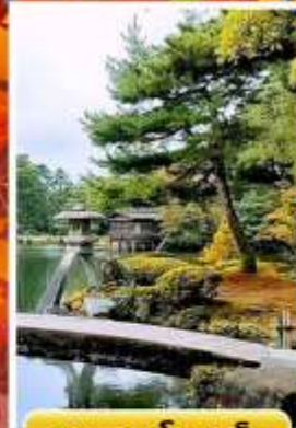
สวนเคนโระคุเอ็น

🍲 ออนเซ็น 3 คั้น 🧳 นน.กระเป๋า 23 กก. ☀️ 7Days 5Night