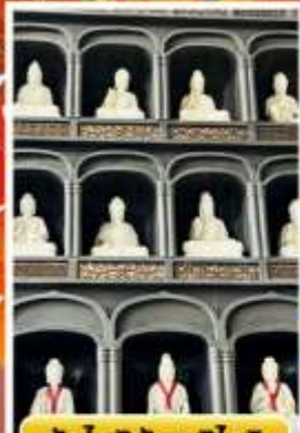
วัดไดชิซังเฮอิไดจิ