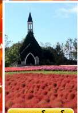
สวนบกกะโนะซาโตะ