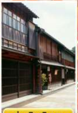
ย่านอิงาชิบายะ