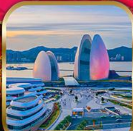
Zhaihai Opera House