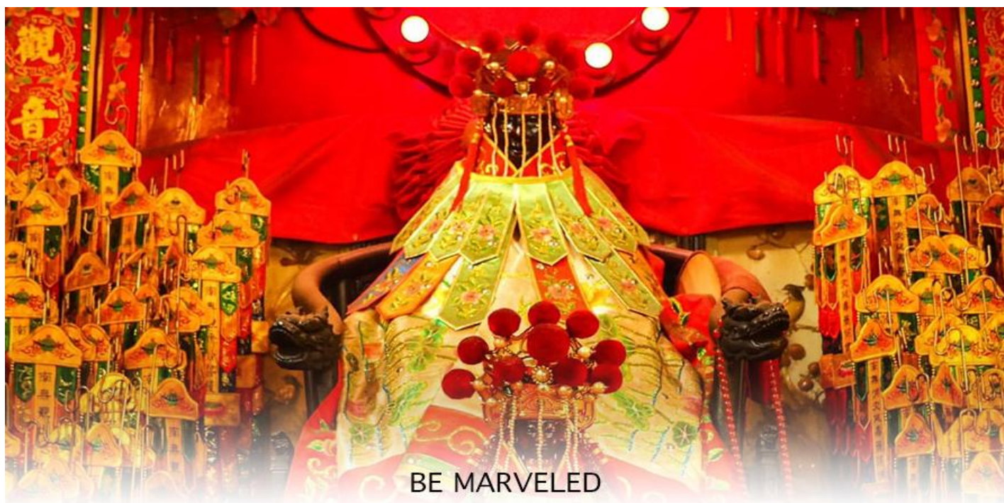
BE MARVELED วัดเจ้าแม่กวนอิมสองอำ (ยิมฮิน)

จากนั้นนำท่านสู่ เจ้าแม่กวนอิม วัดสองอำ (HUNG HOM KWUN YUM TEMPLE) เป็นหนึ่งในวัดที่เก่าแก่ที่สุดของฮ่องกง และชาวฮ่องกงเลื่อมใสศรัทธามาก สร้างขึ้นในปี ค.ศ.1873 ในสมัยช่วงสงครามโลกครั้งที่ 2 มีการปล่อยระเบิดลงบริเวณใกล้กับวัดแห่งนี้หลายต่อหลายครั้ง ทำให้มีผู้บาดเจ็บและล้มตายมากมาย แต่ชาวบ้านที่หนีเข้าไปหลบภัยในวัดนี้ก็กลับปลอดภัยอย่างปาฏิหาริย์ และตัววัดก็ไม่ได้รับความเสียหายจากเหตุการณ์ทิ้งระเบิดที่น่าอัศจรรย์ ตามความเชื่อของคนจีนใน ฮ่องกง-มาเก๊า จะมี "วันเปิดทรัพย์" หรือ "พิธียืมเงิน เจ้าแม่กวนอิมฮ่องกง" เป็นวันที่จะมาขอพรและยืมเงินเจ้าแม่กวนอิม ซึ่งนับจากหลังวันตรุษจีน ไป 26 วัน จะเป็นวันเปิดทรัพย์ที่จัดขึ้นในทุกๆปี พิธีนี้จะมีเพียงครั้งปีละครั้งเท่านั้น เป็นวันสำคัญอีกวันที่คนหลังไหลมาไหว้ขอพรอย่างไม่ขาดสาย