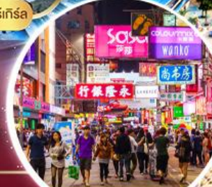
Shopping Tsim Sha Tsui