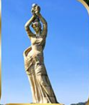
จูไห่ฟิชเชอร์ทรี