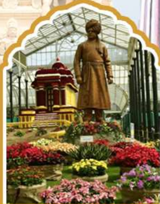
บังกาสอร์