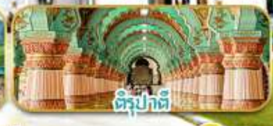
ดีร์ปัตตี