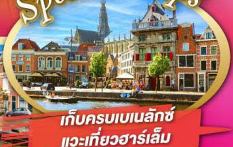
เก็บครบเบเนลักซ์ แวะเที่ยวฮาร์เล็ม