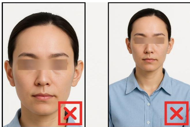
รูปที่ไม่ได้ขนาด ตามที่สถานทูตกำหนด