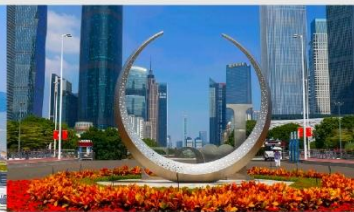
จัตุรัสฮัวเจิง

*ทางบริษัทฯ ขอสงวนสิทธิ์ในการสลับโปรแกรมทัวร์ตามความเหมาะสมขึ้นอยู่กับสถานการณ์หน้างาน โดยคำนึงถึงผลประโยชน์ของลูกค้าเป็นสำคัญ