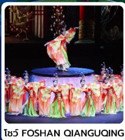
โง่ว FOSHAN QIANGUING