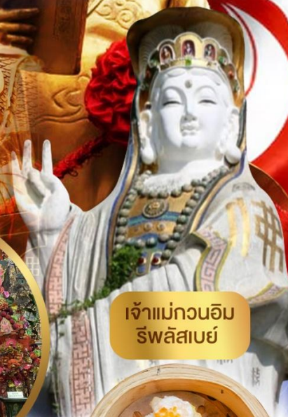
เจ้าแม่กวนอิม ริพลัสเบย์