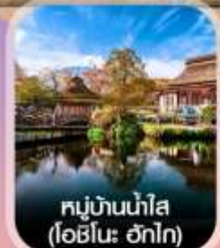
หมู่บ้านน้ำใส (โอชิโนะ ฮักไก)