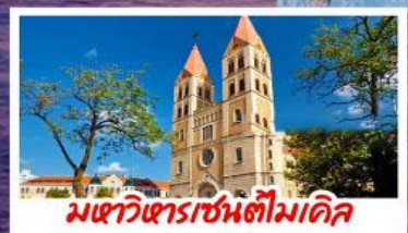
มหาวิหารเซนต์ไมเคิล