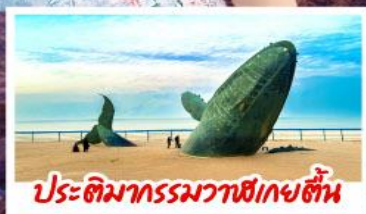
ประติมากรรมวาฬยกตื่น