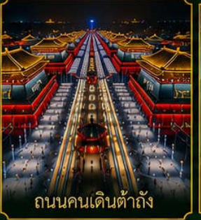
ถนนคนเดินต้าถัง