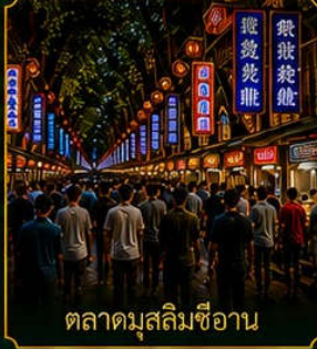
ตลาดมัสลิมซีอาน