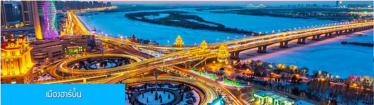
เมืองฮาร์บิน

หลังอาหารนำท่านเดินทางสู่ เมืองฮาร์บิน 哈尔滨市 (ระยะทาง 250 กม. ใช้เวลาเดินทางราว 3 ชั่วโมงเศษ) เมืองฮาร์บินเป็นเมืองที่ตั้งอยู่ทางตอนเหนือของจีนที่มีพรมแดนติดกับประเทศรัสเซีย เป็นเมืองเอกของมณฑลเฮยหลงเจียง มีสมญานามว่าเป็นกรุงมอสโกตะวันออก และได้ชื่อว่าเป็นเมืองหลวงแห่งฤดูหนาวเนื่องจากเมืองแห่งนี้มีช่วงฤดูหนาวยาวกว่าฤดูร้อน มีเทศกาลแกะสลักน้ำแข็งนานาชาติจัดขึ้นที่เมืองนี้ในช่วงฤดูหนาวของทุกปี เป็นจุดหมายปลายทางสำหรับนักท่องเที่ยวทั้งในและต่างประเทศที่ชื่นชอบความสวยงามของหิมะในฤดูหนาว