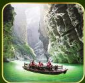
ล่องเรือแม่น้ำไตคินกุฮิว