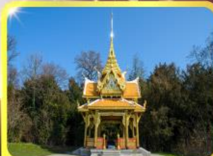
ศาลาไทยไชยาน์