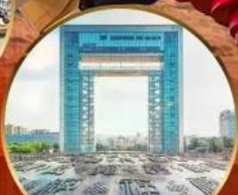
ประตูแห่งความสุข