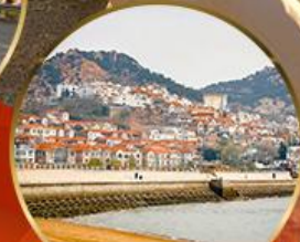
ซาจื่อโข่ว