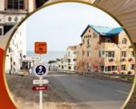
ถนนอ่าวจีป่า