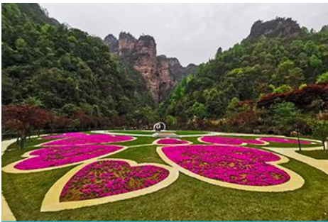
อุทยานฟงเลียนซี