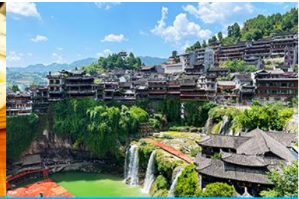
เมืองโบราณฝูหมิงเจี๋ย

วันที่สาม เมืองจางเจี๋ยเจี๋ย-ศูนย์แพทย์แผนจีน-ศูนย์จำหน่ายผลิตภัณฑ์ไชชา-ไกด์นำเสนอ OPTIONAL TOUR สะพานกระจกแกรนด์แคนยอน-เมืองโบราณฝูหมิงเจี๋ยยามค่ำคืน