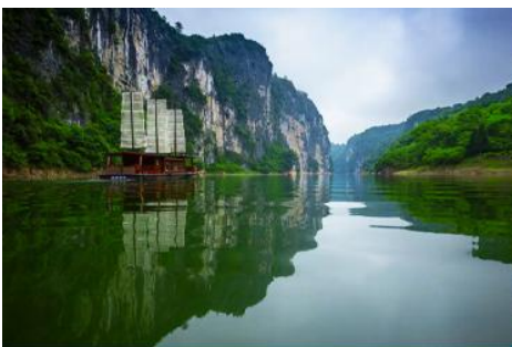
ล่องเรือ เหมาเหยียนเหอ