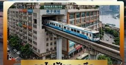
รถไฟฟ้ากะลุดัก