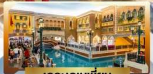
เดอะเวเนเชียน

4 วัน | 3 คืน | น้ำหนักกระเป๋า 23KG | พักโรงแรม 3 ดาว | นอนมาเก๊า 3 คืน