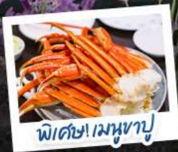
พิเศษ! เมฆงาปู