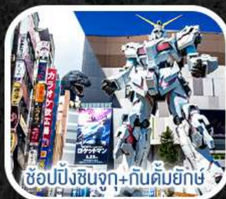
ช้อปปิ้งชินจูกุ+กันดั้มยักษ์