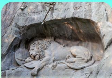
สิงโตหินแกะสลัก