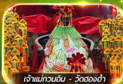
เจ้าแม่กวนอิม - วัดย่องฮำ