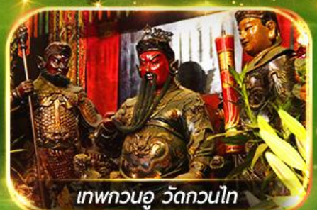
เทพกวนอู วัดกวนไท

ไหว้พระ-จัดเต็มขอพร 9 วัดดัง, นั่งกระเช้ามองปิง สักการะพระใหญ่โป้วหลิน ทะลุดิสนีย์แลนด์ ชมพลุสุดอลังการ !!