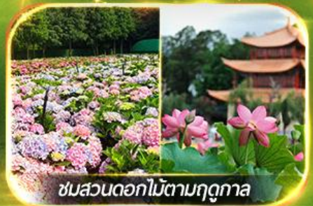
ชมสวนดอกไม้ตามฤดูกาล

นั่งกระเช้ากุเขาศิมะเจี้ยวจื่อ ชมน้ำตกสุดอลังการสวนน้ำตกคุนหมิง ช้อปปิ้งถนนคนเดินหนานผิงเจี๋ย, ชมดอกไม้ตามฤดูกาล