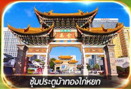
ซุ้มประตูม้าทองไก่หยก