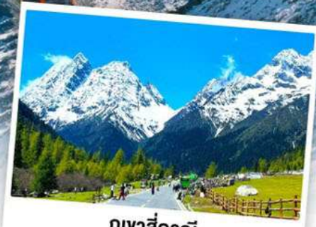
กุเวาสีครุณี

เดินทางโดย: สายการบินเจิงตูแอร์ไลน์ (EU)