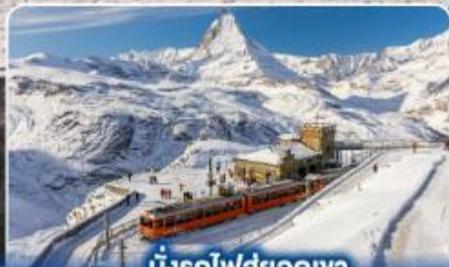
นั่งรถไฟสุดอลเวง กรอนเนอร์เกรต