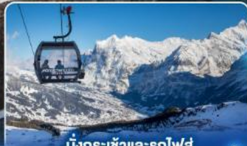
นั่งกระเช้าและรถไฟสุด ยอดเขาจุงเฟรา